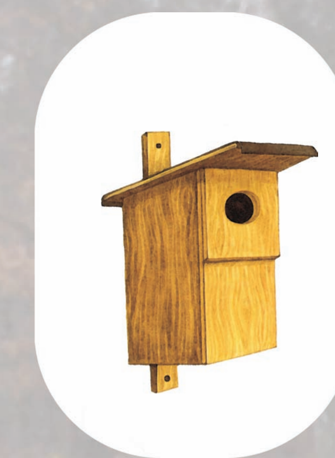
budka dla sikory, pleszki i muchołówki