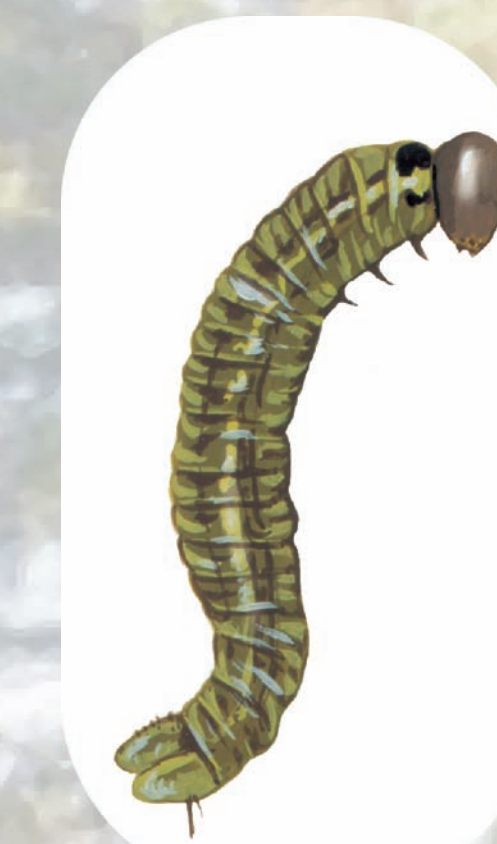
larwa osnu gwiazdzistej