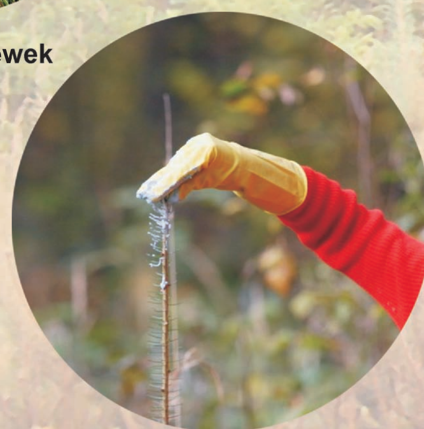
smarowanie pędów repelentem – środkiem odstrasżającym zwierzęta