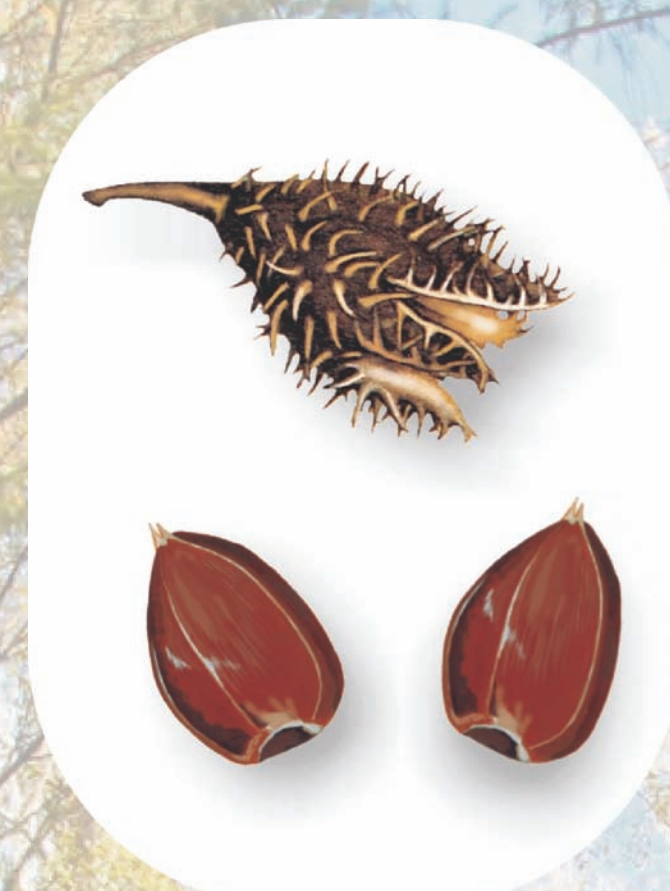
bukiew (owoce buka)