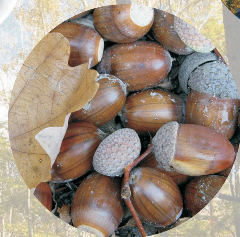
żołędzie (owoce dębu)