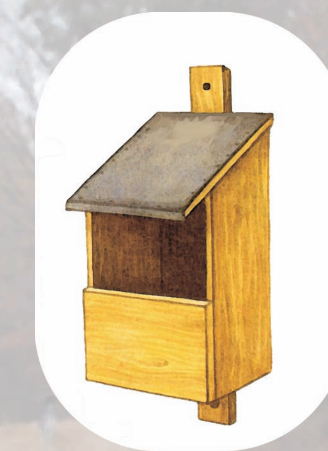
budka dla rudzika, pliszki i kopciuszka