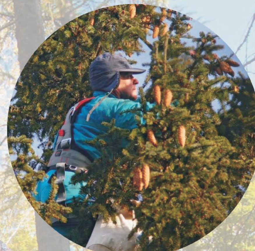
zbiór szyszek świerka

zbieranie szyszek i owoców w celu pozyskania nasion do siewu