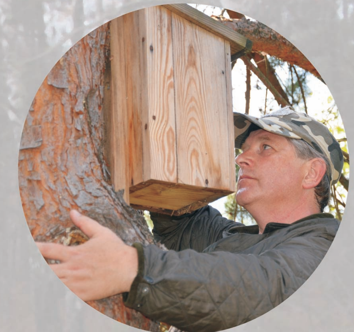
usuwanie piór, resztek pokarmu i innych nieczystości po każdym lęgu