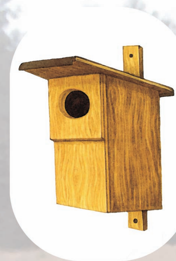
budka dla dzięcioła, dudka i kowalika

zbieranie szyszek i owoców w celu pozyskania nasion do siewu