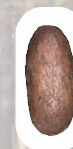
kokon z poczwarką borecznika sosnowca