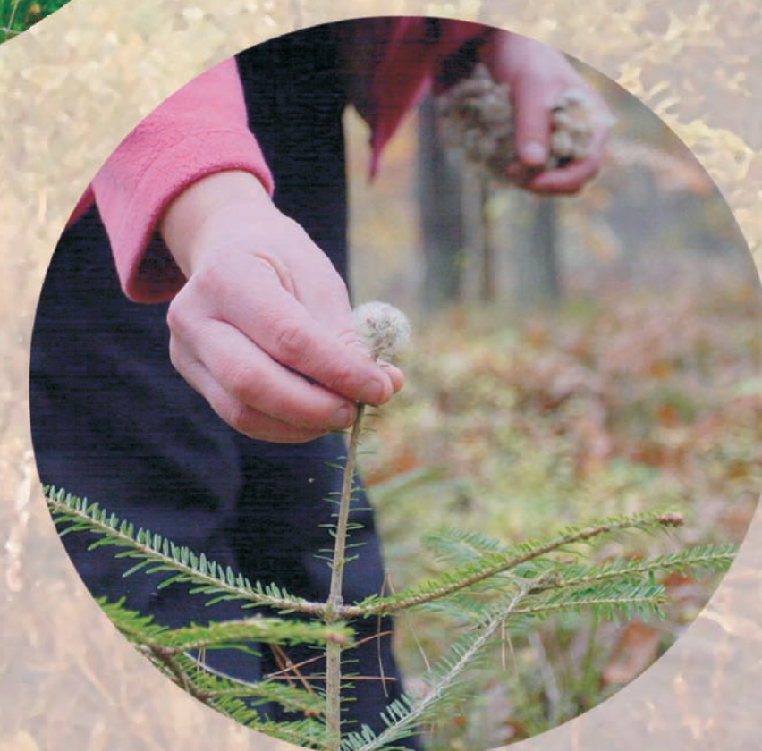
pakułowanie – osłanianie pędów pakułami